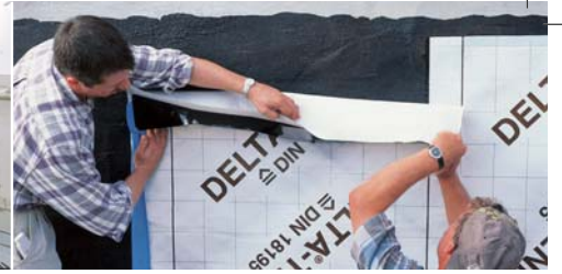
Bodrum duvarları güvenilir bir şekilde korunur.