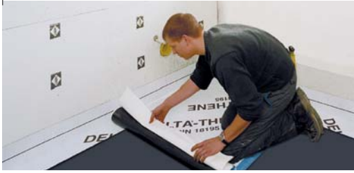
Rulodan hızlı bir şekilde uygulanabilir.