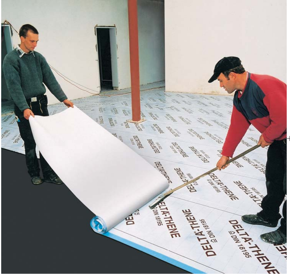
Geniş yüzeyleri DELTA®-THENE ile kolayca ve hiçbir engebe olmadan yalıtabilirsiniz.