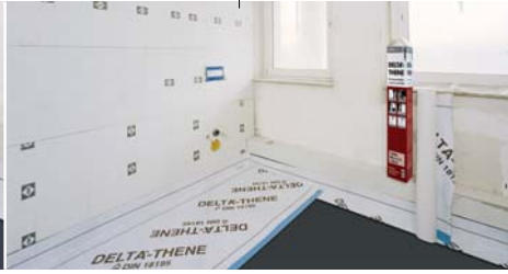
Islak mekanlarda güvenli bir şekilde yalıtım sağlanabilir.