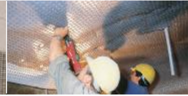
Tünelde DELTA®-PT püskürtme beton taşıyıcısı olarak kullanılır.