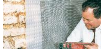
Duvara kolayca sabitlenir.

Su geçirmez. Isıya dayanıklıdır. Duvar ile sıva arasında havalandırma.