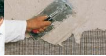
Sıvayı mala ile kolayca sürün.