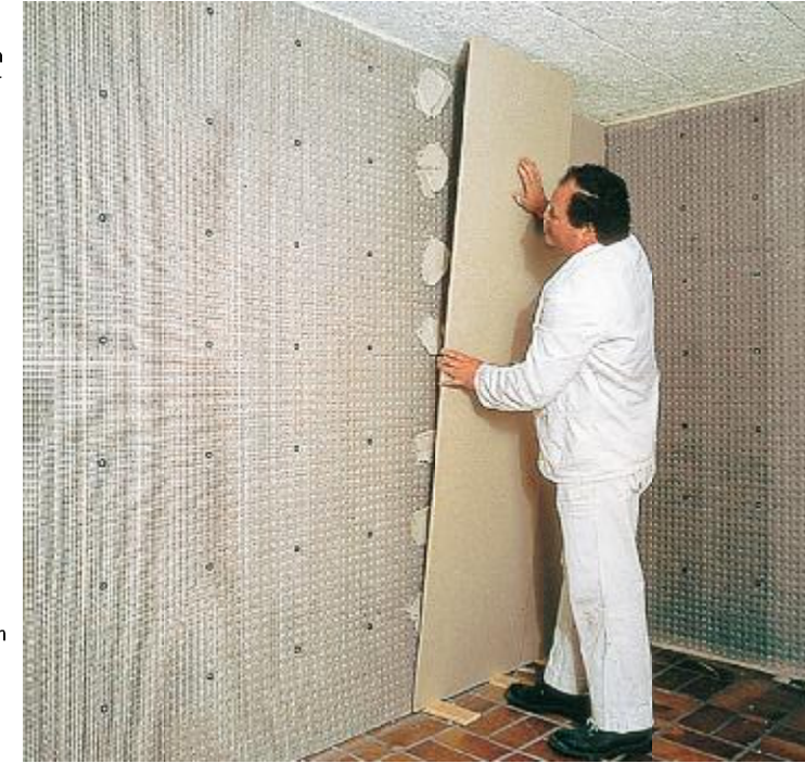
DELTA®-PT, alçı ve kireçli çimento sıvalar veya alçıpan levhalar için su geçirmeyen, sabit bir temel oluşturur.