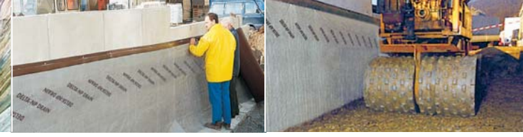
Levha, darbelere karşı dayanıklıdır ve deforme olmaz. Ağır yüklerde de maksimum dayanıklılık.