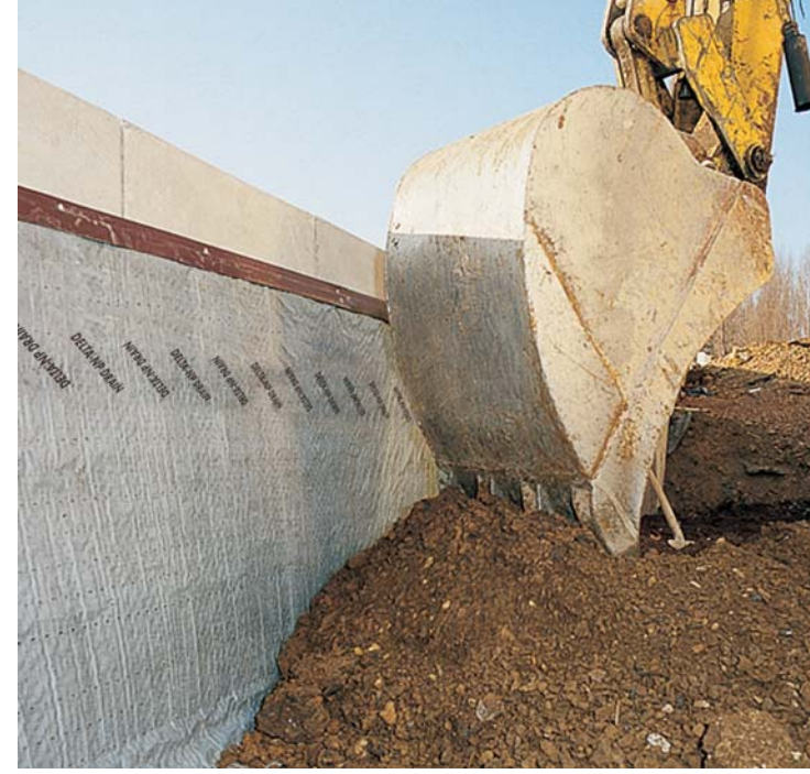
DELTA®-NP DRAIN hızlı, güvenli ve hesaplı bir şekilde uygulanır.