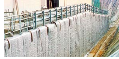
Yeraltı yapıları için güvenilir düşey drenaj.

Su daima uzaklaştırılır. Çürümez. Hesaplıdır.