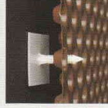
DELTA®-TERS DÜBEL Bindirme yerlerinin birleştirilmesinde montaj yardımı olarak kendinden yapışkanlı sabitleme çivisi.