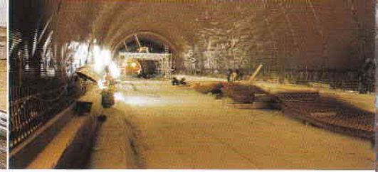
Tünellerde etkili yüzey drenajı.