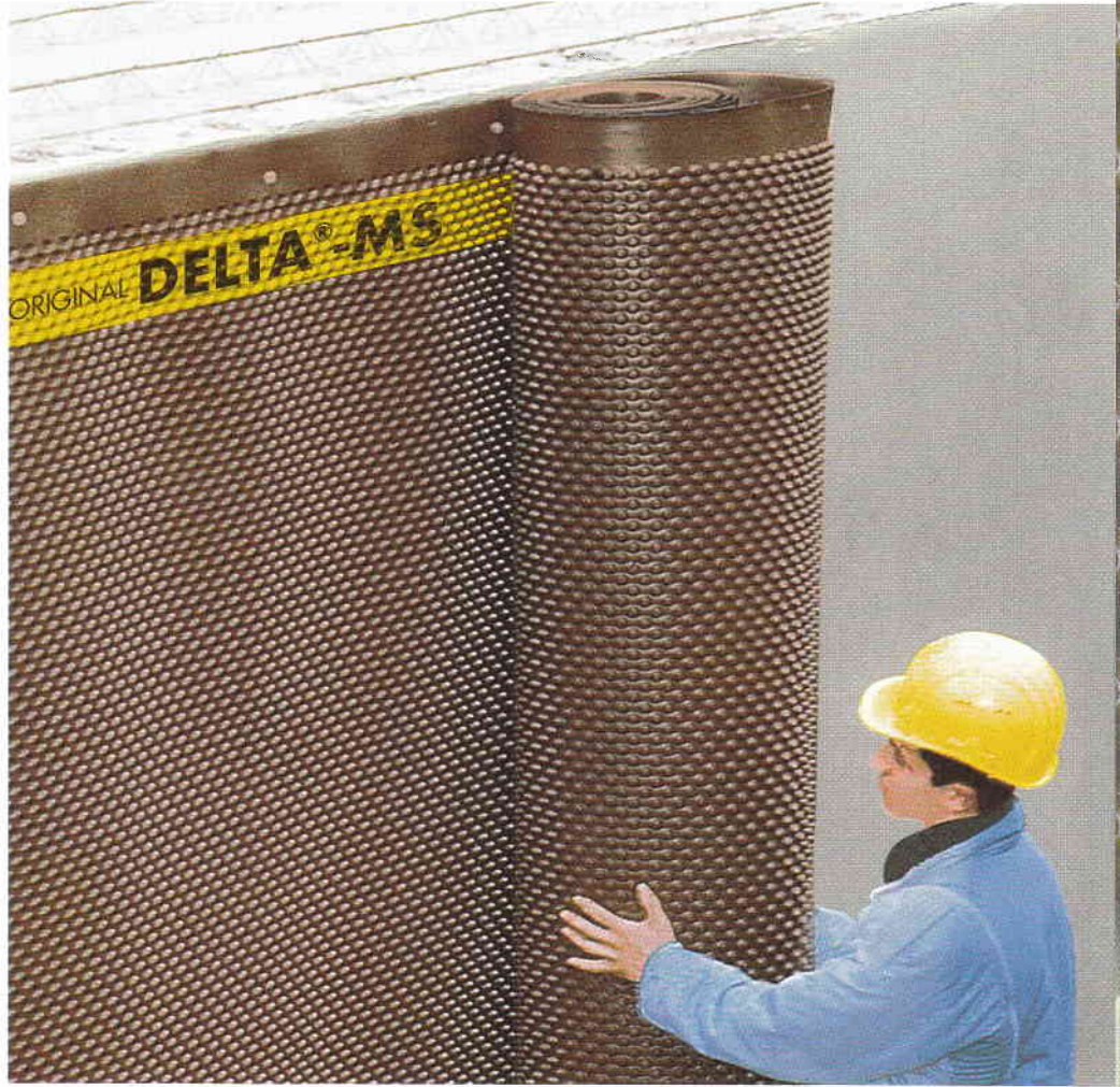
DELTA®-MS kolayca döşenir ve temel duvarı için güvenli bir koruma sağlar.