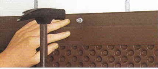
Üst kenar bitişi olarak DELTA®-MS PROFIL.