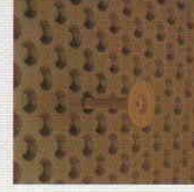
DELTA®-MS DÜBEL Çivi kullanımı mümkün olmayan alt zeminde yapılacak montajlar için plastik çakma dübeli.