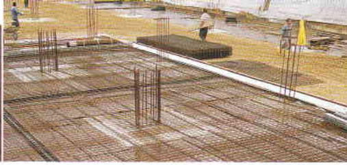
Temel altında güvenilir grobeton alternatifi.