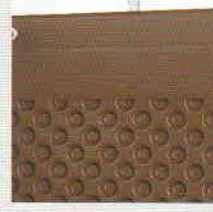
DELTA®-MS PROFİL Kenar kapama profili.

Bu nedenle pratik DELTA®-aksesuarlarının ilginizi çekeceğini düşünüyoruz: