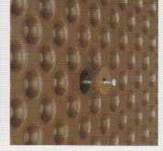
DELTA®-MS DÜĞME Kabarcıklı levhanın çivi çakılabilen alt zemine sabitlemesinde olası bir yırtılmayı önler.

DELTA® ist ein eingetragenes Warenzeichen der Ewald Dörken AG, Herbolke.