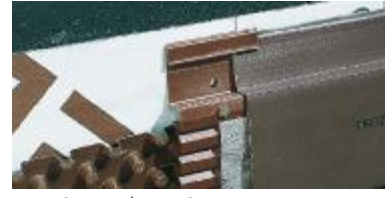
DELTA®-MS PROFİL, DELTA®-GEO-DRAIN CLIP ile birlikte.