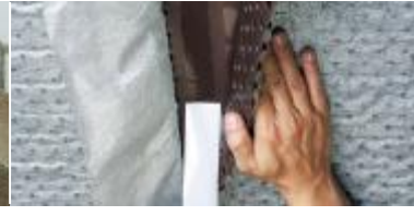
Kolayca döşenmesi için entegre kendinden yapışkanlı kenar.