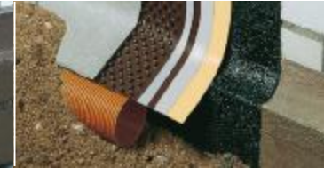
Levha, drenaj borusunda sona erer.