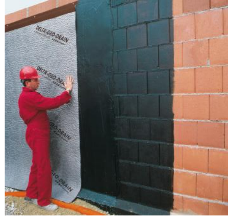
DELTA®-GEO-DRAIN Quattro - kompakt ünite olarak tek aşamada hızla döşenir.

■ ... 10 m'ye kadar montaj derinliklerinde kullanılabilir.