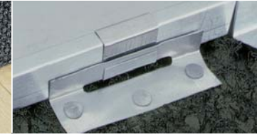
Çatı kaplamasının sorunsuz bir şekilde genişmesini sağlar.