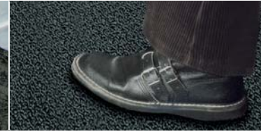
Kolayca yürünen, kaymayan kabarcıklı yapısı sağlar.

■ Dışta: DELTA®-TRELA Metal çatının alt tarafında nemin birikmesine izin vermeyin. Korozyonu etkili bir şekilde önleyin. Ve etkileyici mimari yapıyı koruyun.