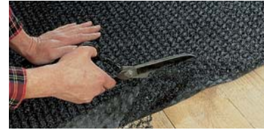
Kolay ve hızlı bir şekilde uygulanır.

Nemin birikmesini önler. Korozyonu durdurur. Damlama seslerini azaltır.