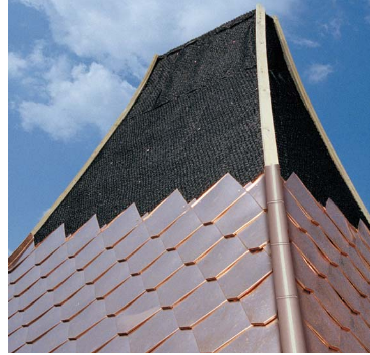
DELTA®-TRELA, yüksek kalitede metal çatılar için en iyi ayırma tabakasıdır.

DELTA®-TRELA PLUS rüzgar geçirmeyecek şekilde hızla döşenmesini sağlayan entegre kendinden yapışkanlı kenar ile.