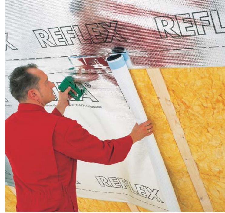
DELTA®-REFLEX - üniversal hava ve buhar bariyeri.

DELTA®- REFLEX PLUS Kendinden entegre edilmiş yapışkanlı bant ile