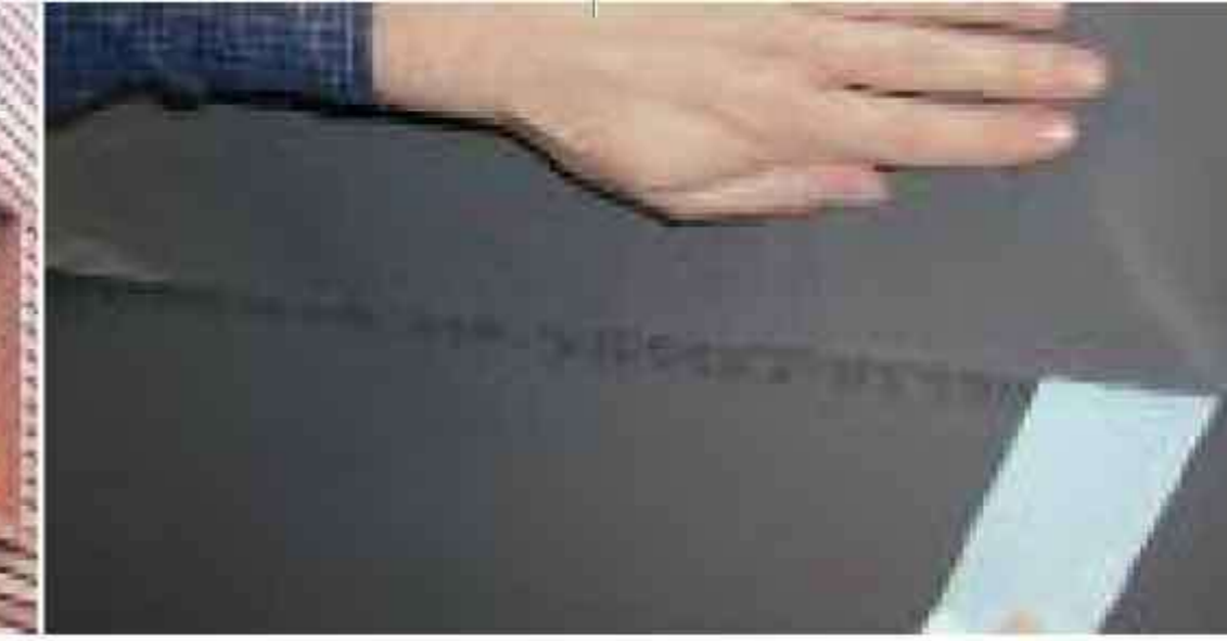
Kendinden yapışkanlı bindirme kenarına sahip DELTA®-FASSADE PLUS.