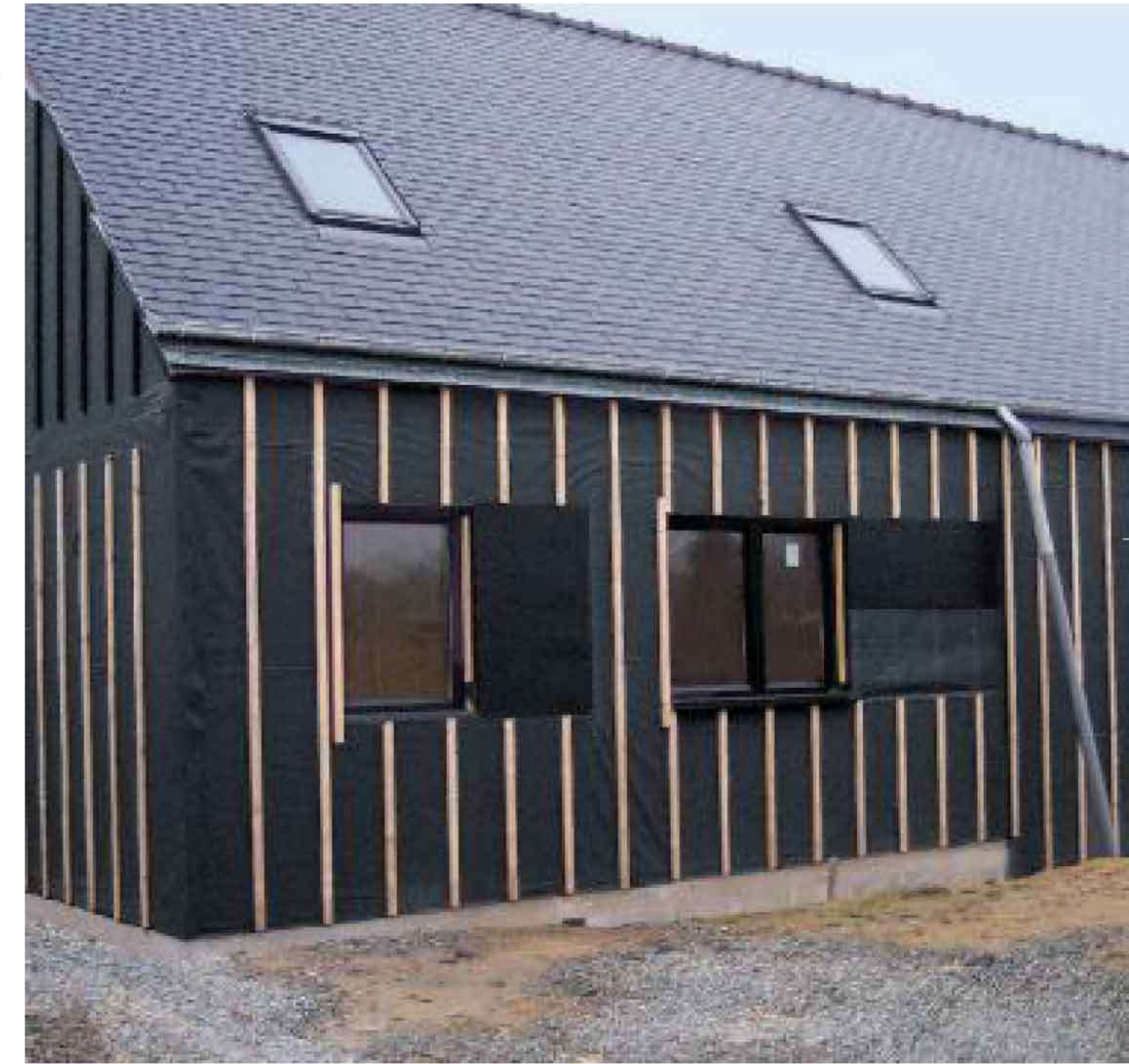
DELTA®-FASSADE S, maksimum 50 mm genişliğinde bağlantılarla açık pervazlar altında güvenli bir koruma sağlar.

DELTA®-FASSADE PLUS ve DELTA®-FASSADE S PLUS, kendinden yapışkanlı bindirme kenarı kısmı ile daha hızlı rüzgara dirençli kurulum sağlanmaktadır.