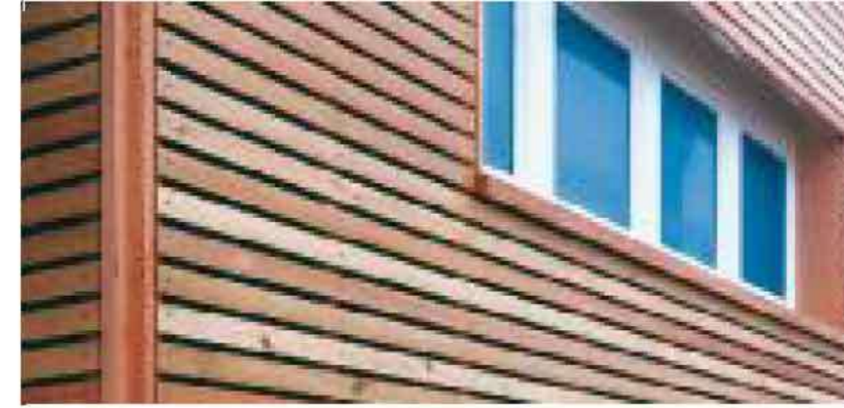
Ahşap direkler ve kirişler için ideal çözümler.

Çeşitli inşaat yapıları için. Su geçirmez. Kopmaya karşı yüksek seviyede dayanıklı.