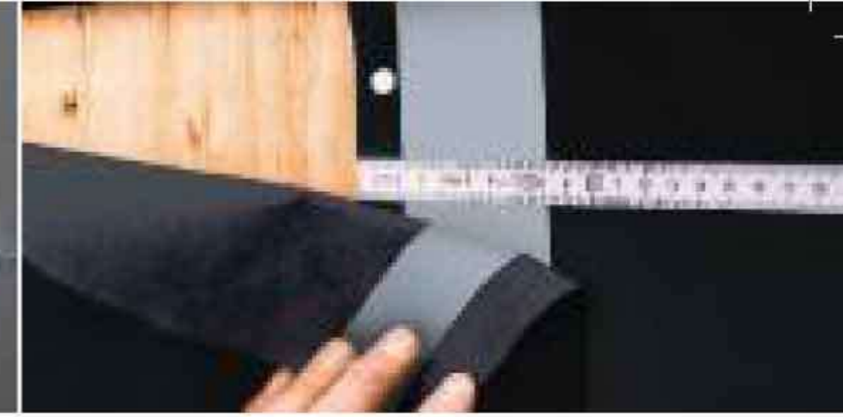
10 cm'lik bindirmeye sahip kaplama örtüleri.